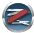
Икона на раздел Отрасли.

В село Гложене съществуват традиции, свързани с дървообработването, металообработването и електротехниката. От десетилетия в селото съществуват заводи, които осигуряват работни места за много семейства. Като изключим новосъздадените фирми - „Арлес“ и "Енерджи Моторс" ООД, в селото от доста време съществуват предприятията: „ГЛОКОМ - 98“ АД и "БУК - Тетевен" АД. Важно място в раздела заемат и заведененията за хранене, местата за отдих и имотите за продажба.